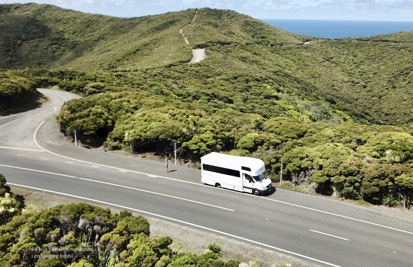
På Nya Zeelands nordspets i en lyxigare husbil.