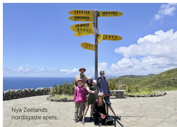
Nya Zeelands nordligaste spets.