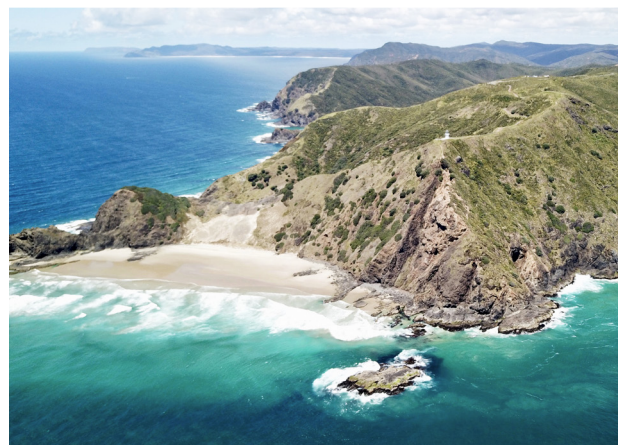
Den nyinköpta drönaren skapade upplevelser från ovan. Inte minst på Nya Zeeland där landskapet varierade stort.